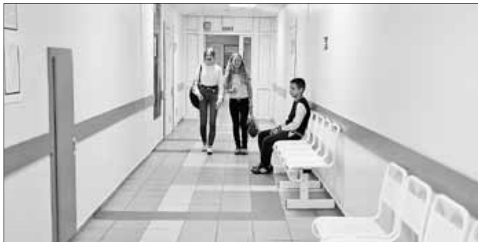
■ Отремонтированные коридоры в здании стационара