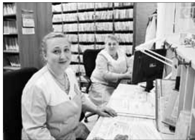
■ В регистратуре обновленной стоматологии

Кстати, для решения кадровой проблемы больница заключает целевые договоры со студентами: трое ребят учатся в СГМУ, еще двое поступили в этом году.