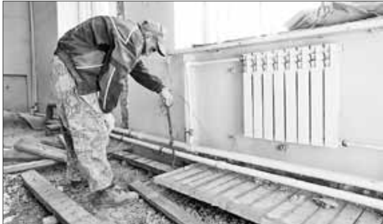
■ Рабочие меняют коммуникации в поликлинике, а также заканчивают устройство нового крыльца и козырька над ним