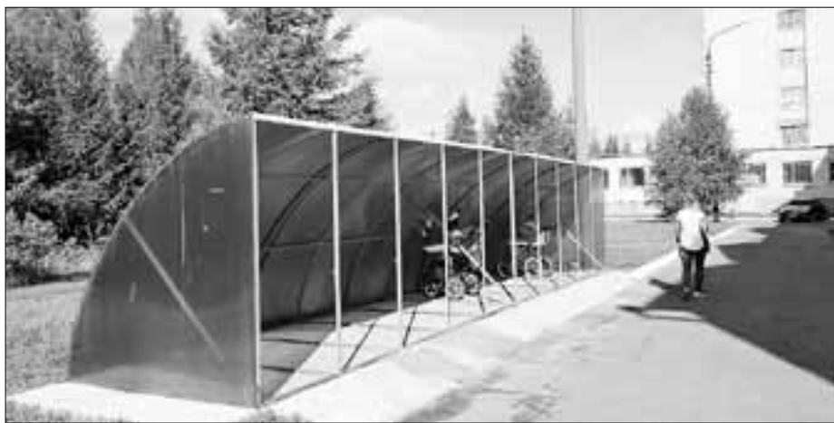
■ Колясочная возле детской поликлиники